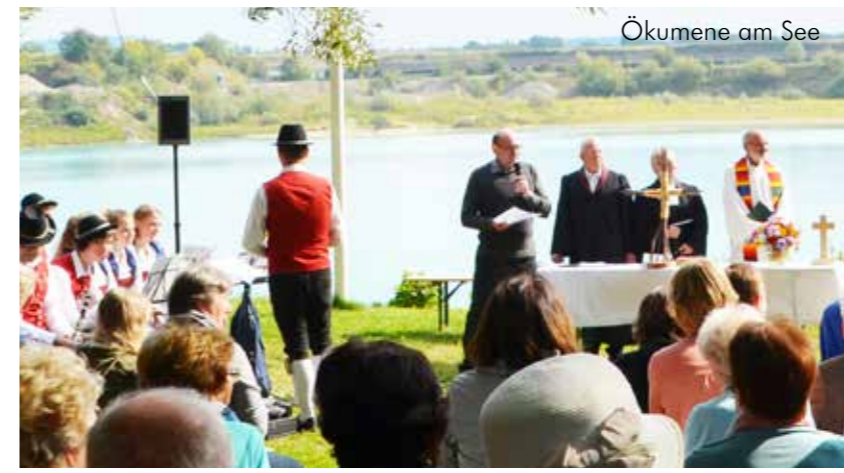
Ökumene am See